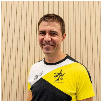
Christian Müller Rechnungsbüro